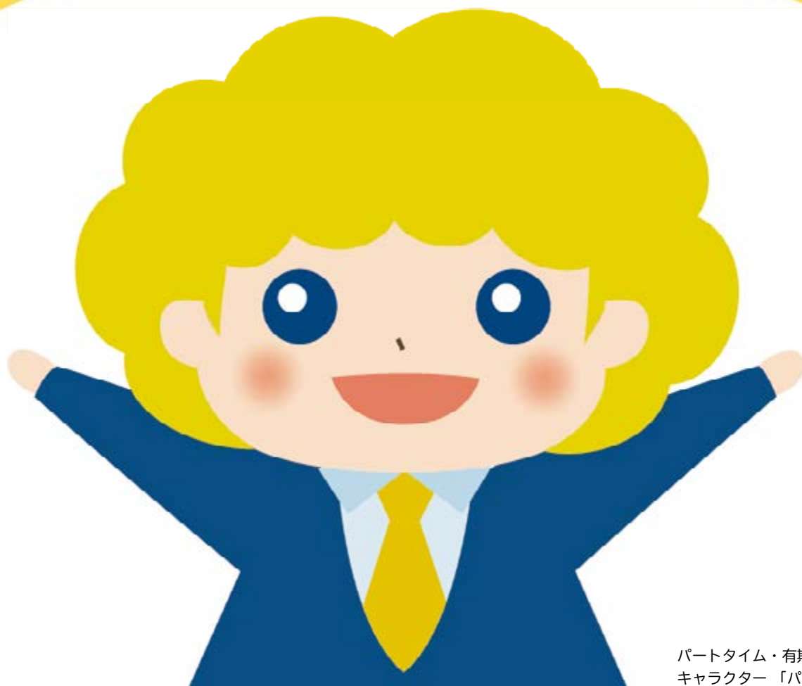
パートタイム・有期雇用労働法 キャラクター「パゆう」ちゃん

このパンフレットに沿って社内の制度の点検をし、制度の改定の必要がないか確認しましょう。